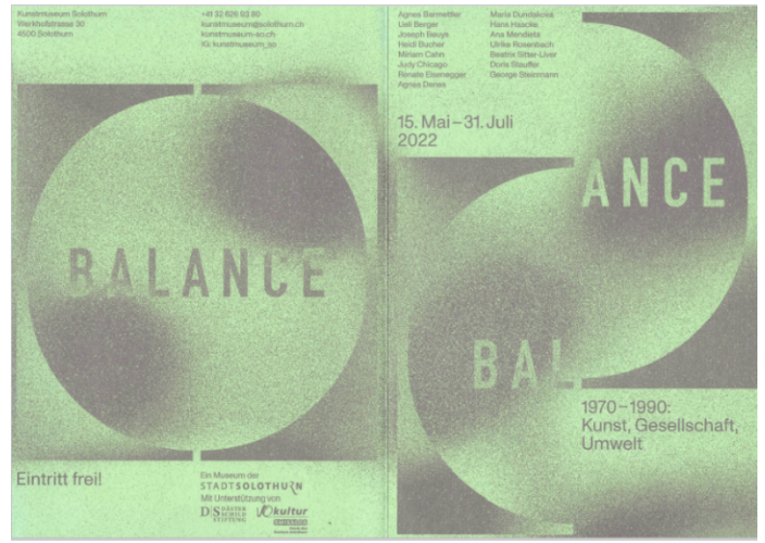
(Kunstmuseum Solothurn, 15. Mai bis 31. Juli 2022)